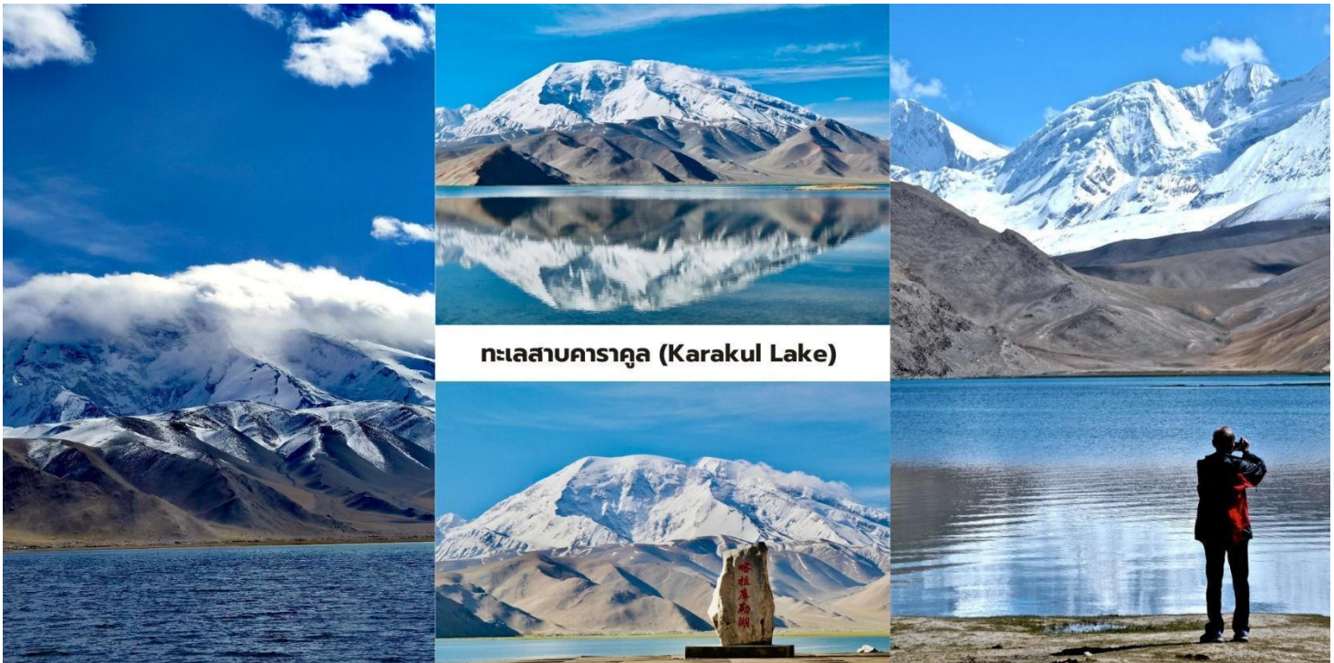
ทะเลสาบคาราคูล (Karakul Lake)

นำท่านแวะชม หนองน้ำดำเหอมา่น (Taheman Wetland/Taxkorgan Wetland) พื้นที่ชุ่มน้ำธรรมชาติบน ที่ราบสูงปามีร์ ซึ่งมีทุ่งหญ้าและลำธารกระจายตัวอยู่ทั่วบริเวณ พื้นที่แห่งนี้เป็น แหล่งอาศัยของนกอพยพและสัตว์ป่านานาชนิด โดยเฉพาะในช่วงฤดูใบไม้ผลิและฤดูร้อนสามารถพบนกหลายชนิด เช่น นกกระเรียน นกฟลามิงโก และนกเป็ดหลากสายพันธุ์ เป็นต้น ในส่วนของบริเวณทิวทัศน์ของพื้นที่ชุ่มน้ำแห่งนี้โดดเด่นด้วย แม่น้ำที่คดเคี้ยวผ่านทุ่งหญ้าสีเขียว โดยมีฉากหลังเป็นภูเขาหิมะแห่งเทือกเขาปามีร์สร้างภาพธรรมชาติที่แตกต่างจากภูเขาหินที่แห้งแล้งของภูมิภาคโดยรอบ