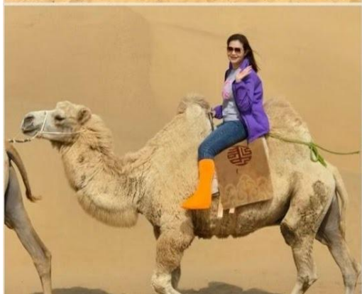
พิเศษ...ขี่อูฐ (รวมค่าขี่อูฐ) สัมพัสประสบการณ์การเดินทางแบบดั้งเดิม