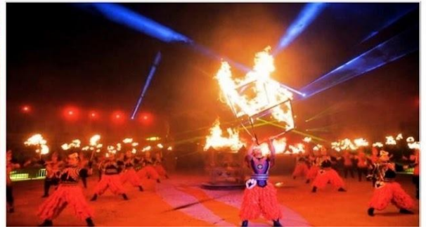
งานราตรีรอบกองไฟมองโกเลีย