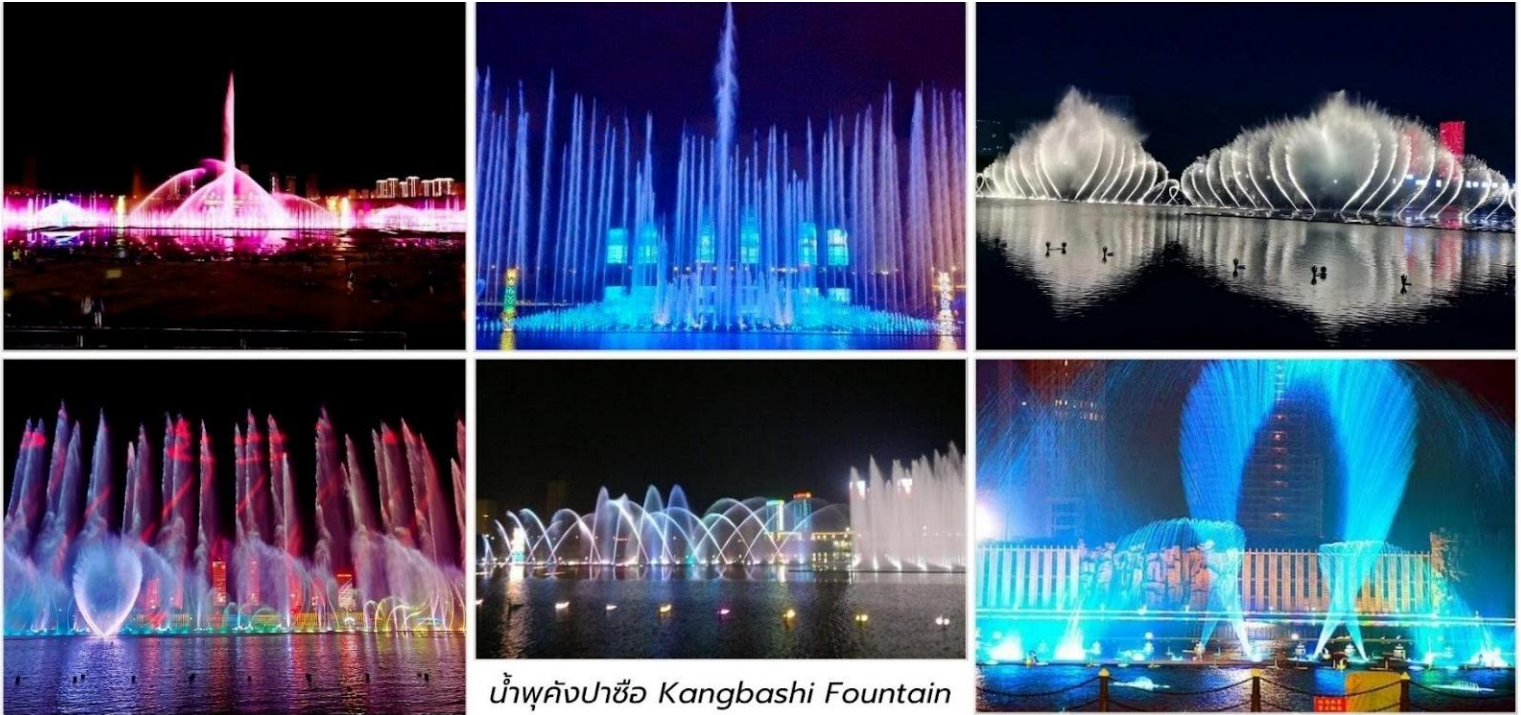
น้ำพุคังปาซือ Kangbashi Fountain

ที่พัก Holiday Inn Express Hotel ระดับ 4* หรือเทียบเท่า