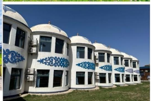
ORDOS GRASSLAND RESORT

ที่พัก Ordos Grassland Resort ระดับ 4* หรือเทียบเท่า ที่พักตกแต่งสไตล์กระท่อมมองโกเลีย ท่ามกลางความงดงามอันกว้างใหญ่ของทุ่งหญ้าแห่งมองโกเลียใน