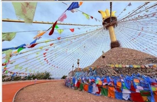
อี้เค่อโอบอ (Great Oboo, 伊克敖包)