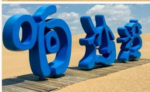
ทะเลทรายเสียงซาวาน