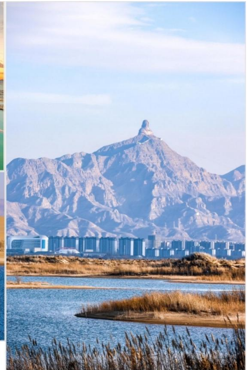
ทะเลสาบอูไห่ (Wuhai Lake, 乌海湖)

จากนั้นนำท่านชม ทะเลสาบอูไห่ (Wuhai Lake, 乌海湖) ชมความมหัศจรรย์โอเอซิส "ครึ่งทะเลทราย ครึ่งทะเลสาบ" ตั้งอยู่ในเมืองอูไห่ เขตปกครองตนเองมองโกเลียใน เป็นจุดหมายปลายทางที่ไม่เหมือนใคร ซึ่งสร้างสรรคปรากฏการณ์ทางธรรมชาติอันน่าทึ่ง ทะเลสาบแห่งนี้เกิดจากโครงการผันน้ำจากแม่น้ำเหลือง ทำให้ผืนน้ำกว้างใหญ่มาบรรจบกับทะเลทรายอูลานบูเหอ (Ulan Buh Desert) ก่อเกิดเป็นโอเอซิสกลางทะเลทรายที่งดงามราวสวรรค์ ทศนิยมภาพสองโลกในหนึ่งเดียว ทางหนึ่งคือผืนทรายสีทองของทะเลทรายที่ทอดยาวสุดลูกหูลูกตา อีกทางหนึ่งคือผืนน้ำสีฟ้าครามใสสะอาดที่สะท้อนท้องฟ้า เป็นภาพตัดกันที่สวยงามและหาชมได้ยาก