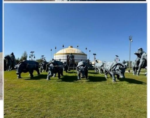
เขตท่องเที่ยวเจงกิสข่าน • กลุ่มประติมากรรม กองทัพเหล็กและกระโจมทอง