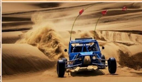
OPTION TOUR เลือกซื้อกิจกรรม สนุกสุดเหวี่ยงในทะเลทราย