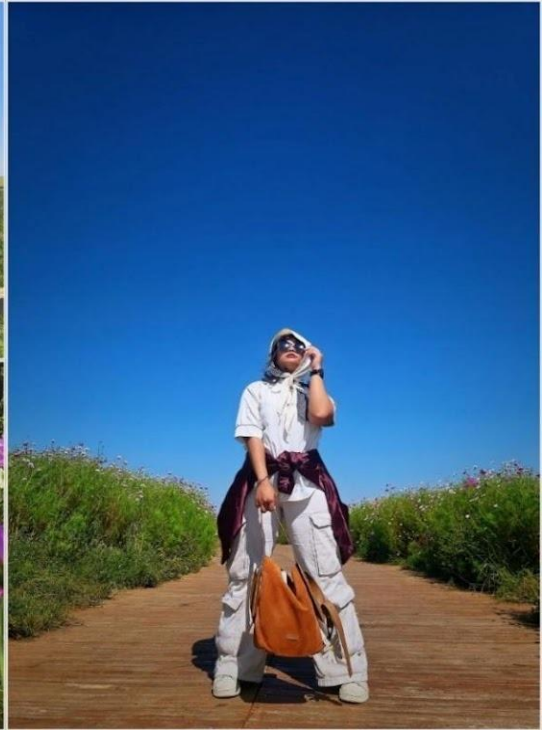
ทุ่งหญ้าออร์ดอส (Ordos Prairie)