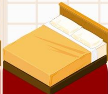
ห้องพักเตียงใหญ่ 1 เตียง (DOUBLE BED ROOM)

*ในกรณีไม่มีริควอลและจอง 2 ท่าน ทางบริษัทฯจะจัดห้อง TWN เป็นหลัก