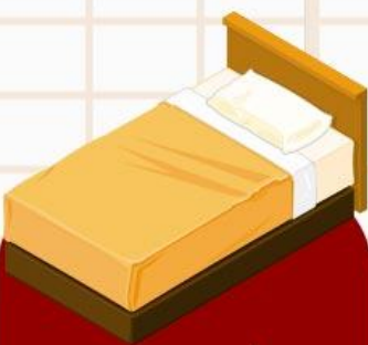
ห้องพักเตียงเดี่ยว (SINGLE BED ROOM)

ห้องพักสำหรับนอนท่านเดียว แต่มีค่าใช้จ่ายเพิ่มเติม จากค่าทัวร์