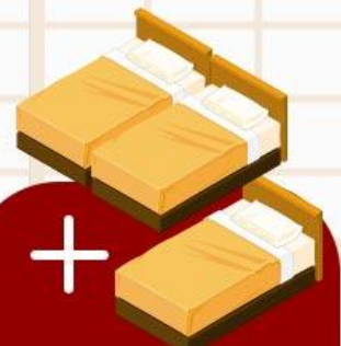
ห้องพัก 1 ห้องสำหรับ 3 คน (TRIPLE BED ROOM)

*กรณีที่บางโรงแรมไม่มีห้องประเภทนี้ ทางใดก็จะเปลี่ยนเป็นห้อง TWN แทน