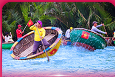
ล่องเรือกระดัง หมู่บ้านกิมทาน