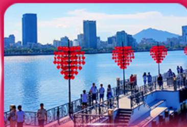
สะพานแห่งความรัก