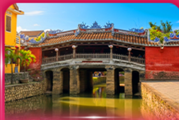
สะพานญี่ปุ่นโบราณ ฮอยอัน