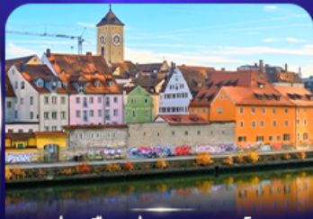
ย่านเมืองเก่า เรเกินสบูร์ก