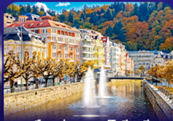
เมืองแห่งสปา คาร์ลสวั วารี