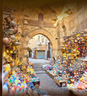
ตลาดห่านเอลคาลีลี