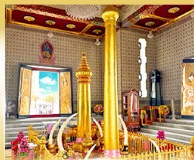
ศาลหลักเมือง กรุงเทพมหานคร