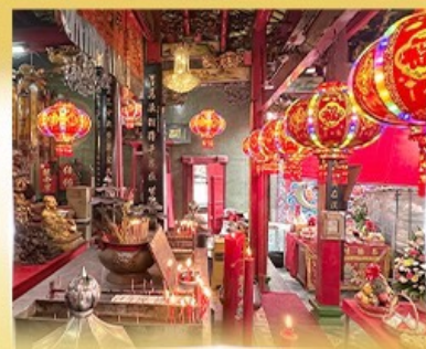
ศาลเจ้ากวนอู คลองสาน