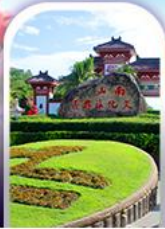
อุทยานหนานซาน

ทางเดินริมชายทะเลซานย่า • กุ้งดอกกุหลาบอ่าวย่าหลง อุทยานหนานซาน • เทียบบนเกาะดอกไม้ • กุ้งเกลือพันปี ช้อปปิ้งไนท์มาร์เก็ตถนนโบราณฉีหลว