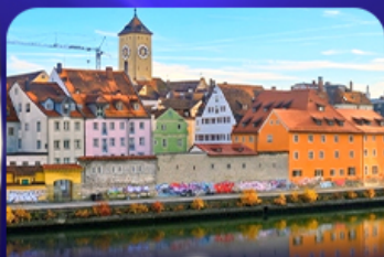
ย่านเมืองเก่า เรเกินสบูร์ก