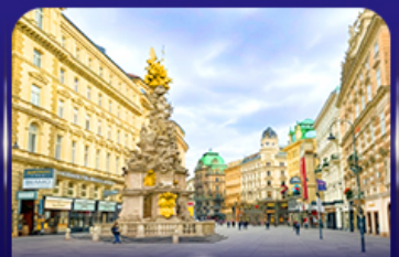
คาร์ทเนอร์ สตรีท เวียนนา