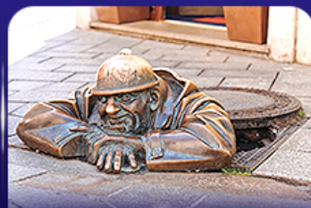
รูปปั้นคูมิล บราติสลาวา