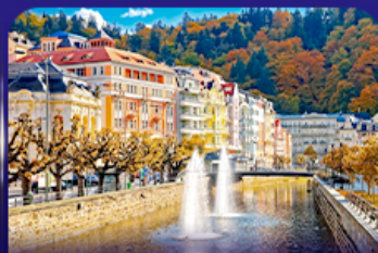
เมืองแห่งสปา คาร์ลสวั วารี