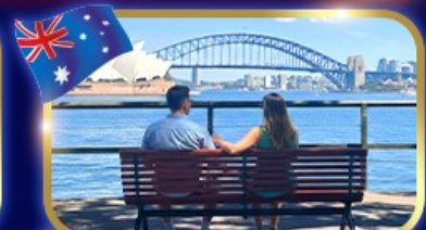
ชมวิวอ่าว สวนน้ำหินแบคควอรี่