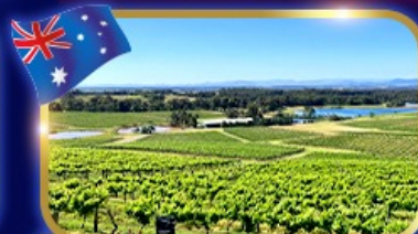
ชมไร่องุ่น โรมันไวน์ระดับโลก