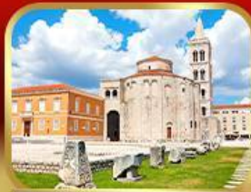
โบสถ์เซนต์โธมัส ซาเกรบ