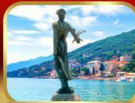
ราชินีแห่งอาเดรียติก โอฟาเทีย