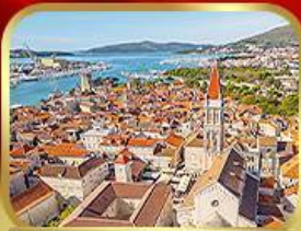
มหาวิหารเซนต์โลว์เรนซ์