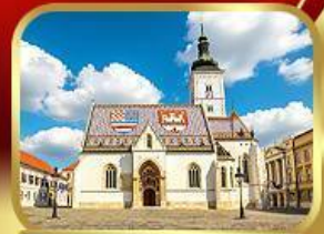
โบสถ์เซนต์มาร์ก ซาเกรบ