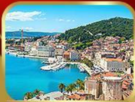
ชมย่านเมืองเก่าสปลิก