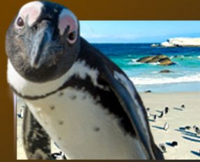
Simon's Town ชมฝูงเพนกวิน