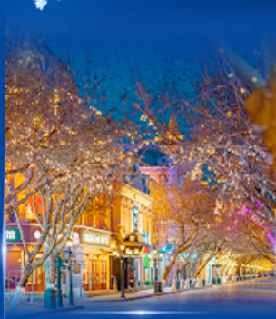
ย่านจงหยาง สตรีท