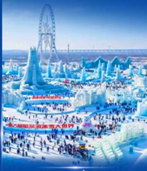
เทศกาลหิมะและน้ำแข็ง 2027