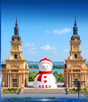
ตุ๊กตาหิมะยักษ์ ฮาร์บิน