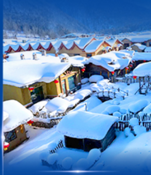
หมู่บ้านหิมะ สโนว์ทาวน์