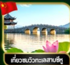
เที่ยวชมวิวทะเลสาบซีหู