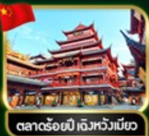
ตลาดร้อยปี เจียงหวงเมี่ยว