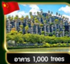
อาคาร 1,000 trees