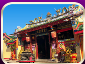
ศาลเจ้าแม่ลิ้มกอเหนี่ยว

ที่เที่ยวเพิ่มขึ้น และ ช่วยฟื้นฟูเศรษฐกิจขาดใหญ่