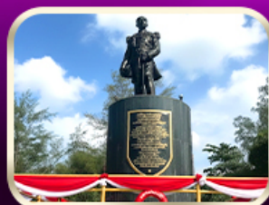
อนุสาวรีย์กรมหลวงชุมพรฯ