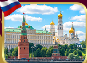
พระราชวังเครมลิน