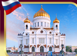
มหาวิหารเซนต์ซาเวียร์