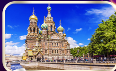
โบสถ์แห่งหยดเลือด