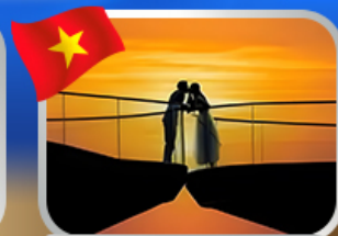
ชมอาทิตย์ตก ณ สะพานงู