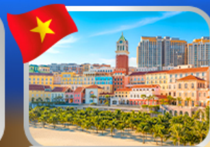
Sunset Town Phu Quoc