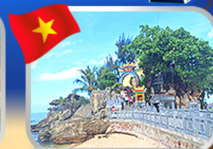
สักการะขอพรศาลเจ้ามังกร