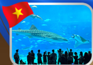
The Sea Shell Aquarium