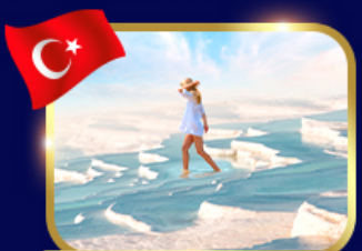
ปราสาทปูยีฝาย ปามุคคาเล่