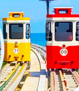
นั่งรถไฟปู๊กบีก

ราคานี้รวมค่าภาษีน้ำมัน + ค่าภาษีสนามบิน ** ปรับขึ้น ณ วันที่ 1 เม.ย. 69 เรียบร้อยแล้ว **