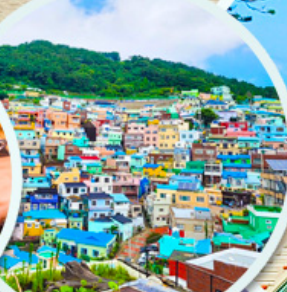
หมู่บ้านดัมซอน