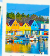
ท่าเรือสีสัน