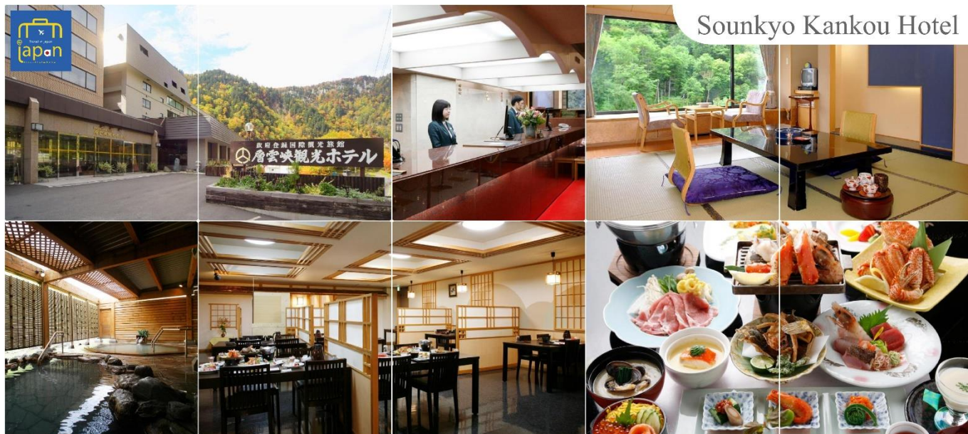
Sounkyo Kankou Hotel

หลังอาหารให้ท่านได้ผ่อนคลายกับการแช่น้ำแร่ธรรมชาติ เชื่อว่าถ้าได้แช่น้ำแร่แล้ว จะทำให้ผิวพรรณสวยงามและช่วยให้ระบบหมุนเวียนโลหิตดีขึ้น