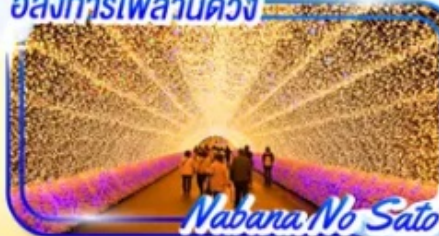
Nabana No Sato