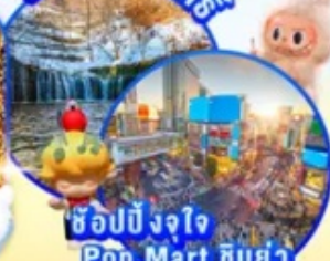
ช้อปปิ้งจุใจ Pop Mart ชิบูย่า