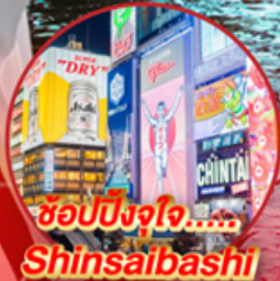
ช้อปปิ้งใจ..... Shinsalbashi

📍 โอโคโน! ชมใบไม้เปลี่ยนสีที่สวยงามที่สุดในภูมิภาค ณ หมู่เขาโคริงเค อสังการไฟลันดวณ ณ หมู่บ้านนาบะ โนะ ซาโตะ ชม หมู่บ้านมรดกโลกการ์นตีโดย UNESCO ณ หมู่บ้านชิราคาว่าโตะ ปราสาทมัตสึโมโตะ เป็น 1 ใน 12 ปราสาทดั้งเดิมที่ยังคงสมบูรณ์และสวยงาม ชมสวนสไตล์ญี่ปุ่น และเยือน วัดกินคะคุจิ หรือ วัดเงิน แห่งเมืองเกียวโต