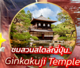
ชมสวนสไตลญี่ปุ่น.. Ginkakuji Temple

📍 โอไลท์!! ชมใบไม้เปลี่ยนสีที่สวยงามที่สุดในภูมิภาค ณ หุบเขาโคริงเค เยือน ศาลเจ้าฟูชิมิอินาริ เสาโทริอิพันต้นแห่งเกียวโต ช้อปปิ้งจิวelry ย่านชินไซบาชิ พร้อมเชคอิน ป้ายกูลิโกะแมน แห่ง โดทงโบริ