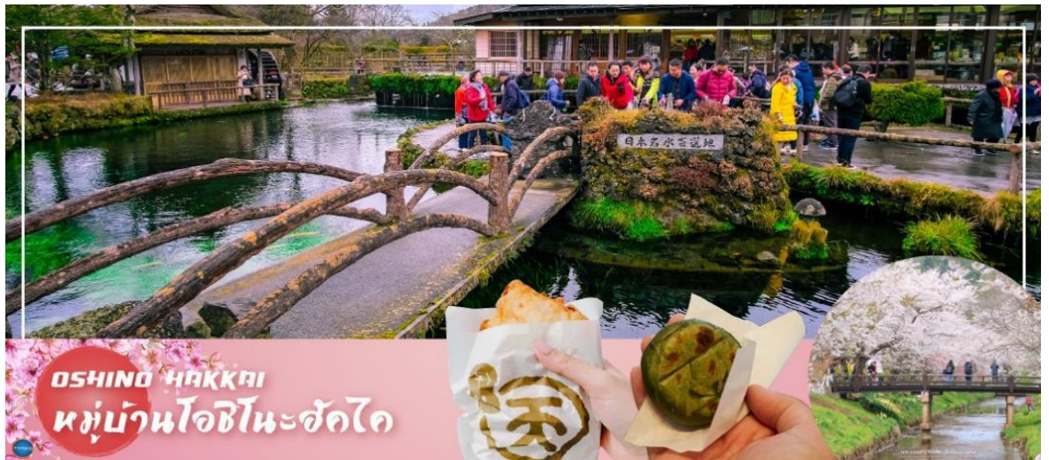
OSHINO HAKKAI หมู่บ้านโอชิโนะซัคได

รับประทานอาหารกลางวัน ณ ภัตตาคาร (2) จากนั้นนำท่าน ขึ้นกระเช้าภูเขาโอมุโระ (Mt.Omuro) (ใช้เวลาเดินทางโดยประมาณ 1 ชั่วโมง) ซึ่งเป็นภูเขาใจกลางเมืองเป็นปากปล่องภูเขาไฟที่ดับไปนานแล้ว สามารถขึ้นไปดูวิวภูเขาไฟฟูจิได้ ถ้าไม่เคยขึ้น Ski lift มาขึ้นที่นี่ ก็จะไม่น่ากลัวมากเพราะไม่สูงมากนัก ทางเดินสะดวกแต่เป็นเนินเบื้องหลังจะเป็นชายฝั่งมหาสมุทรที่สวยงาม รูปทรงภูเขาสวยงาม เดินได้รอบปากปล่องภูเขาไฟสะดวกไม่เป็นอันตราย**ตามรอยอนิเมะชื่อดังอย่าง Your Name**ได้เวลาอันสมควรนำท่านเดินทางสู่จังหวัดยามานาชิ (Yamanashi) (ใช้เวลาเดินทางประมาณ 2 ชั่วโมง) จากนั้นนำท่านเดินทางสู่หมู่บ้านโอชิโนะซัคได (Oshino Hakkai) ให้ท่านเจาะลึกตามหาแหล่งน้ำบริสุทธิ์จากภูเขาไฟฟูจิที่เป็นแหล่งน้ำตามธรรมชาติตั้งอยู่ในหมู่บ้านโอชิโนะ จ.ยามานาชิ หรือพูดในทางกลับกันคือกลุ่มน้ำผุดโอชิโนะซัคได เพียงก้าวแรกที่ย่างเท้าเข้าไปในหมู่บ้านก็สัมผัสได้ถึงอากาศบริสุทธิ์ และไอเย็นจากแหล่งน้ำธรรมชาติที่มีให้เห็นอยู่ทุกมุม โดยในบ่อน้ำใสแจ๋วมีปลาหลากหลายพันธุ์แหวกว่ายอย่างสบายอารมณ์ แต่ขอบอกเลยว่าน้ำแต่ละบ่อนั้นเย็นจับใจจนแอบสงสัยว่าบ่อน้ำไหนหนาวสะท้านกันบ้างหรือ เพราะอุณหภูมิในน้ำเฉลี่ยอยู่ที่ 10-12 องศาเซลเซียสนอกจากชมแล้วก็ยังมีน้ำผุดจากธรรมชาติให้ดื่กดื่มตามอัธยาศัย และที่สำคัญ หมู่บ้านโอชิโนะยังเป็นแหล่งช้อปปิ้งสินค้าโอท็อปชั้นเยี่ยมอีกด้วย