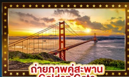
ถ่ายภาพคู่สะพาน Golden Gate