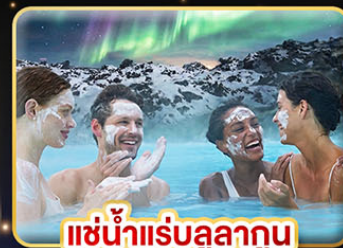
♨️ แช่น้ำแร่ลูลาทูน