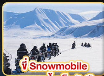
🏍 ขี่ Snowmobile บนธารน้ำแข็งพันปี