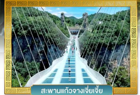
สะพานแก้วจางเจียเจี๋ย

เดินทางโดย: สายการบินเวียดนามแอร์ไลน์ (VZ)