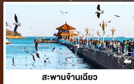
สะพานจ้านเฉียว