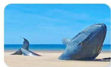
ประติมากรรมวาฬผู้โดดเดี่ยว