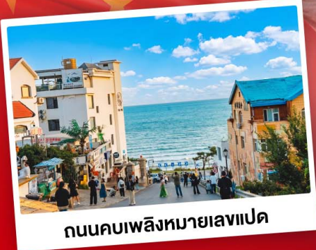
ถนนคอบเพลิงหมายเลขแปด