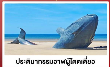
ประติมากรรมวาฬผู้โดดเดี่ยว