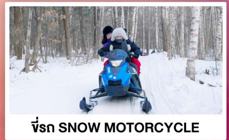
ขี่รถ SNOW MOTORCYCLE