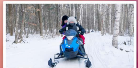
ขี่รถ SNOW MOTORCYCLE