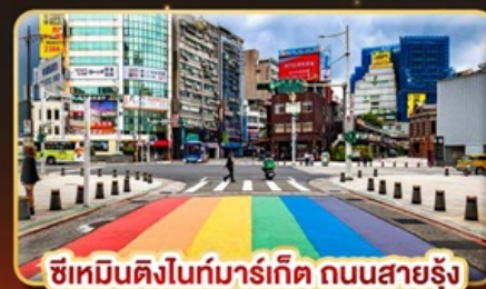
ซีเหมินติงในท่งมาร์เก็ต ถนนสายรุ้ง