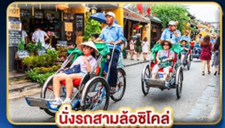
นั่งรถสามล้อฮิโคล