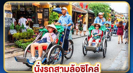
นั่งรถสามล้อฮิโคล่