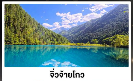
จิ่งจ้ายโกว