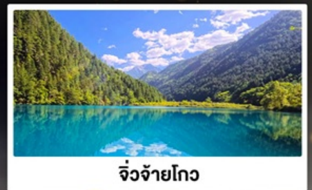
จิ้งจ้ายโกว