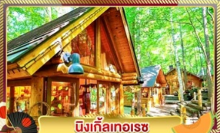
นิงเกิลทอเรซ

ชมทุ่งลาเวนเดอร์ และทุ่งดอกไม้ขึ้นชื่อของฮอกไกโด ฟาร์มโทมิตะ และ ชิโกะไซโนะโอะกะ