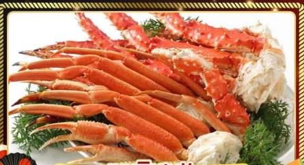
เมนูพิเศษ!! ซูฟุฟตังปูยักษ์ 3 ชนิด