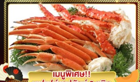
เมนูพิเศษ!! บุฟเฟ่ต์ขาปูยักษ์ 3 ชนิด