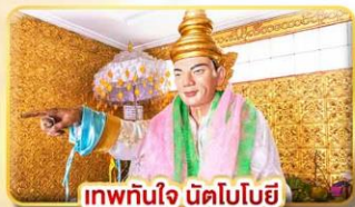
เทพทันใจ นัตโบบิ