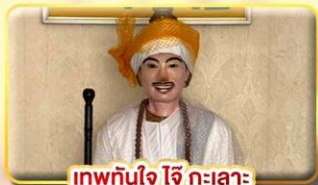
เทพทันใจ ใจ กะเลาะ