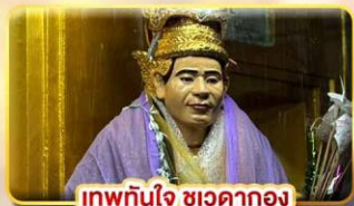
เทพทันใจ ชเวดากอง