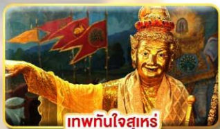
เทพทันใจสุเหร่

โรงแรม เมืองย่างกุ้ง หรือเทียบเท่า 5 ดาว