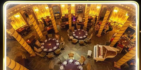
ทานอาหารสุดหรู ร้านTurandot