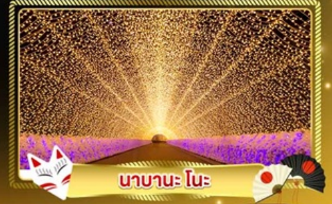
นาบานะ โนะ