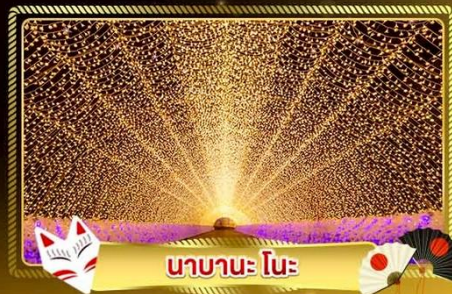
นานาเนะ โนะ