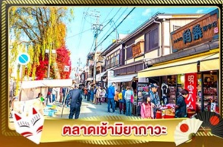
ตลาดซามิยากาวะ