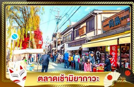
ตลาดซามิยาโกะ