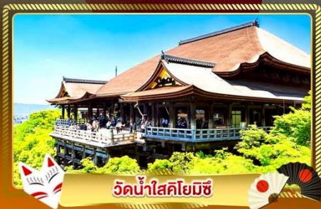
วัดน้ำใสคิโยมิชิ

ชมงานประดับไฟสุดอลังการ นานาเนะ โนะ ซาโตะ