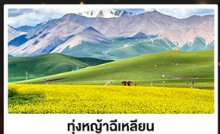
ทุ่งหญ้าฉีหลีเยิน