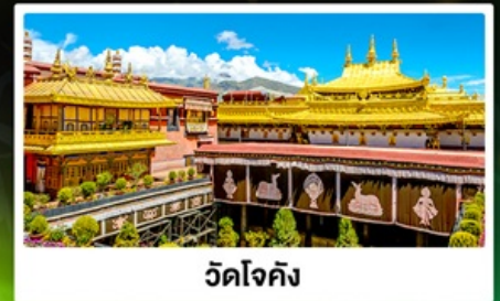
วัดโจคัง