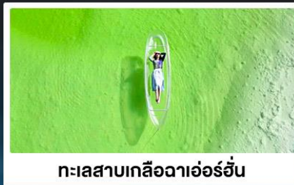
ทะเลสาบเกลือฉาเอ๋อร์ฮั่น