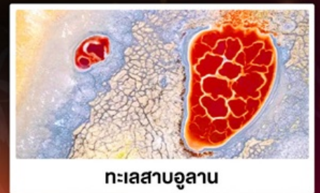
ทะเลสาบอูแลาน