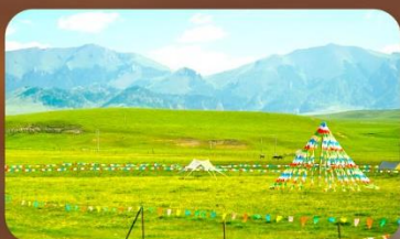
ทุ่งหญ้าออร์คอส