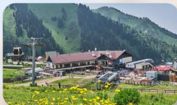
Shymbulak Ski Resort