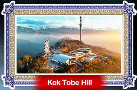
Kok Tobe Hill