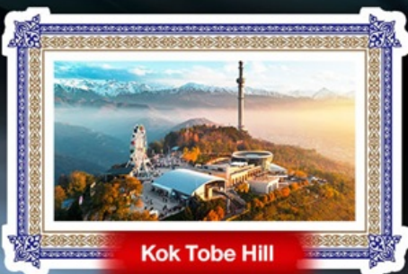
Kok Tobe Hill

สัมผัสวิาวสวย สไตลยุโรป บินตรงอัลมาตี พิเศษ!! ใส่ชุดพื้นเมือง