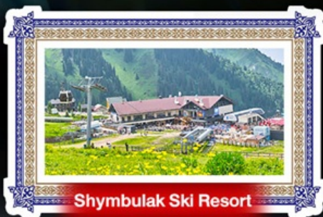
Shymbulak Ski Resort