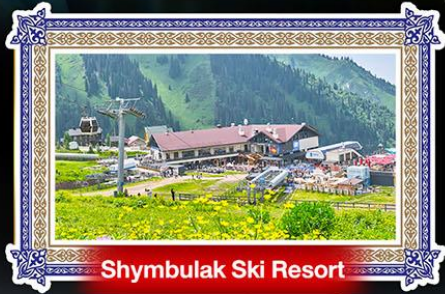
Shymbulak Ski Resort