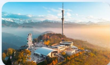
Kok Tobe Hill