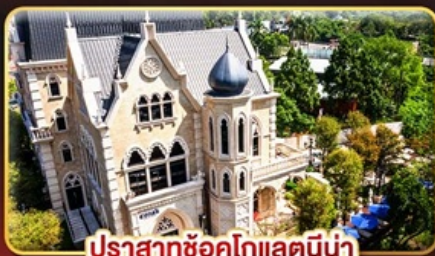
ปราสาทช็อคโกแลตนี้่น่า