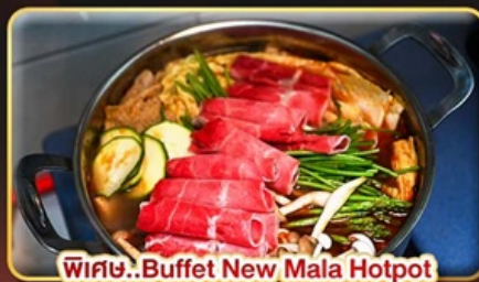
พิเศษ.. Buffet New Mala Hotpot Free Flow Beer & Soft Drink