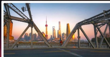
สะพานไวปี้ดู่