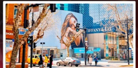
ถนนหวยไห่มีดเคิลโรด