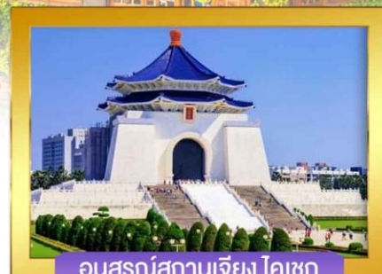
อนุสรณ์สถานเจียง ไคเชก