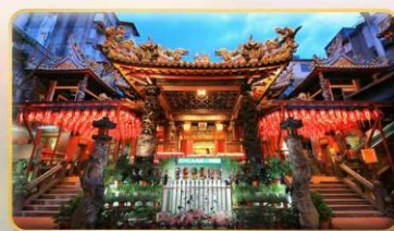
วัดเทียนฮั่ว จอพรเจ้าแม่หม่าจู