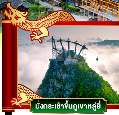
นั่งกระเช้าขึ้นภูเขาหลู่ยี่