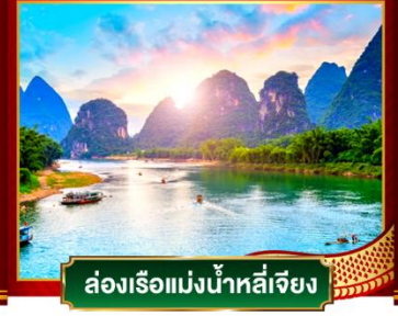
ล่องเรือแม่น้ำหลี่เจียง