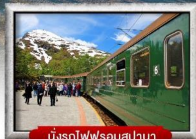
นั่งรถไฟพร้อมสปรานา

พิเศษ! พักบนเรือสำราญ แบบ Window Room 2 คืน, พักบ้านแซนต้าคลอส