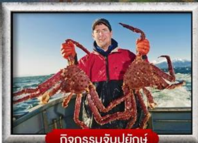
กิจกรรมจับปูยักษ์