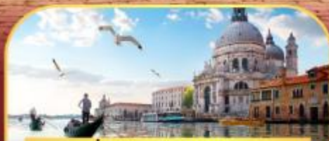
นั่งเรือสุทเกาะเวนิส