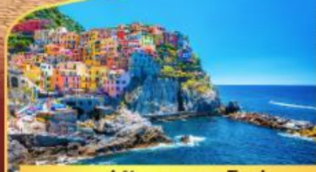
หมู่บ้านมานาโรล่า