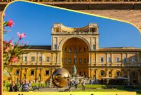
เข้าชมพิพิธภัณฑ์วาติกัน